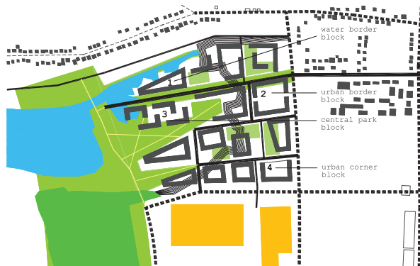
Bouwblokken vormen het stadslandschap.