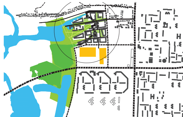
Het plan geïntegreerd in de omgeving.