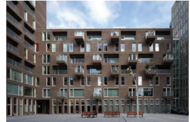
Bouwdeel 1 en 2, IJ-zijde en courzijde.