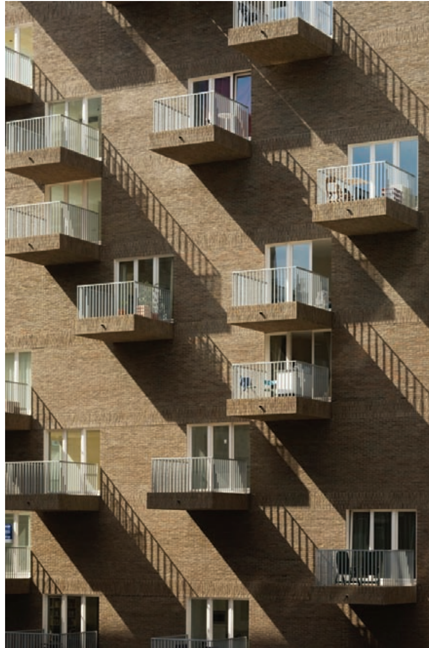
Bouwdeel 10, courzijde.