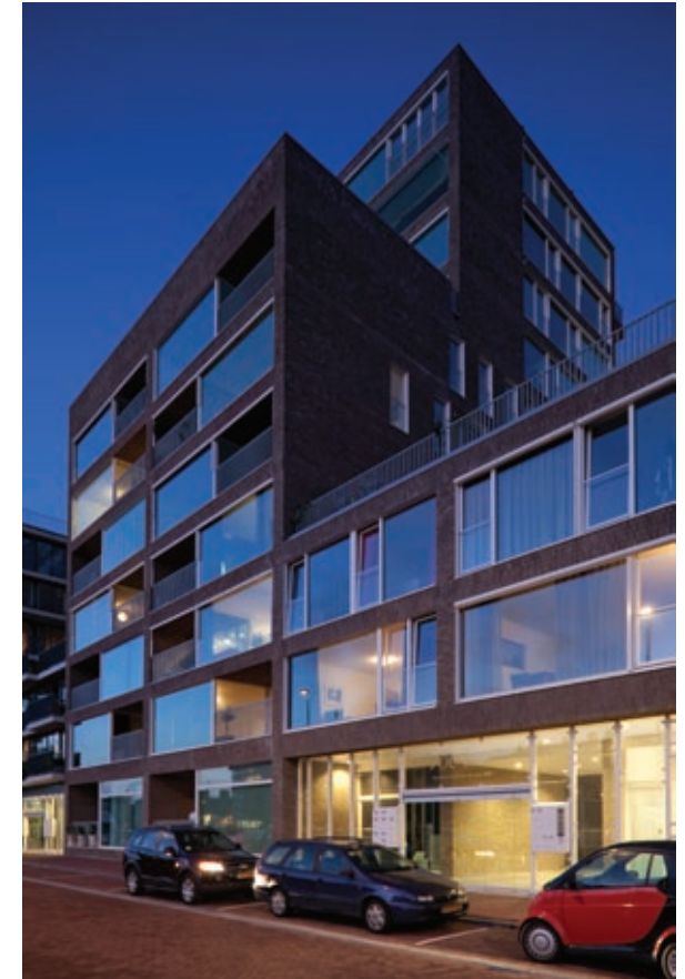
Bouwdeel 9 en 10, Westerdokszijde.